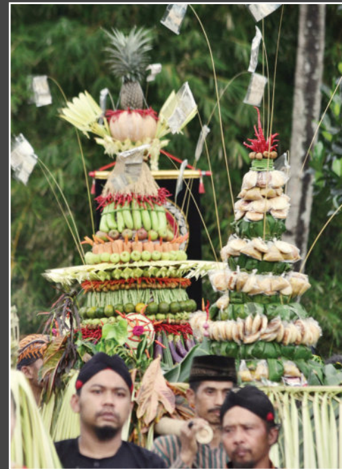
Merti dusun jurugan Bangunkerto Turi Sleman

R AKYAT memang sering mengejutkan. Dalam banyak tradisi adat istiadat dan upacara ritual, mereka menyusun simbol semampunya, sekenanya, seadanya, sebisanya, sesempatnya, untuk mengekspresikan makna niatan hajadnya. Rakyat terasa tidak menganggap penting pencapaian estetika ekspresi, namun lebih penting mengelola proses sosial dengan mempertinggi daya partisipasi. Begitupun dalam menyusun barisan bergada rakyat dan arak-arakan gunungan.