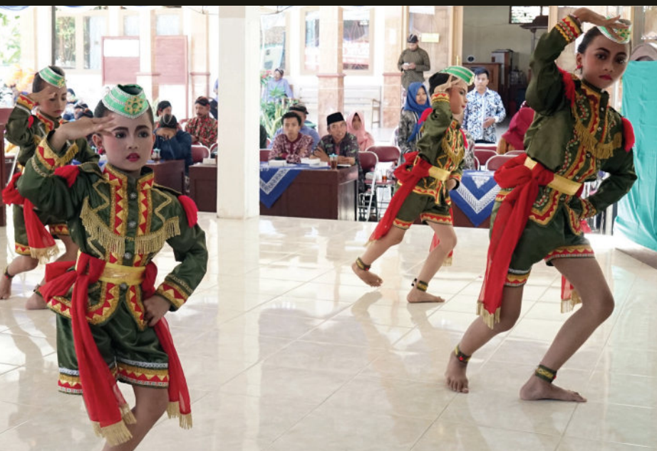
Angguk Putri Kulonprogo dan penabuh gong pada Karawitan Ibu-ibu, seni-seni kekayaan warga Desa Budaya, (foto-fid)

Catatan penting lainnya, dalam hal regenerasi pelaku budaya, masih banyak desa budaya yang belum dirancang dan diupayakan dengan baik. Begitupun koordinasi dan komunikasi antara pelaku budaya, pengurus desa budaya, dan pemerintah desa masih perlu pembenahan dalam semua sisi dan lini. Meski demikian, mulai dapat dikenali, desa-desanya budaya yang memiliki kegairahan beraktivitas budaya di kalangan warga generasi tua, kegairahan beraktivitas budaya di kalangan warga muda dan anak-anak, keaktifan kalangan perempuan, mampu menampakkan diri sebagai desa budaya yang berprospek maju dan mampu memelihara dan mengembangkan keswadayaannya. (pdm)