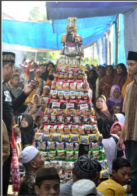
Sadranan makam Ngasem dan nyadranan kampung Bener Tegalrejo Yogyakarta