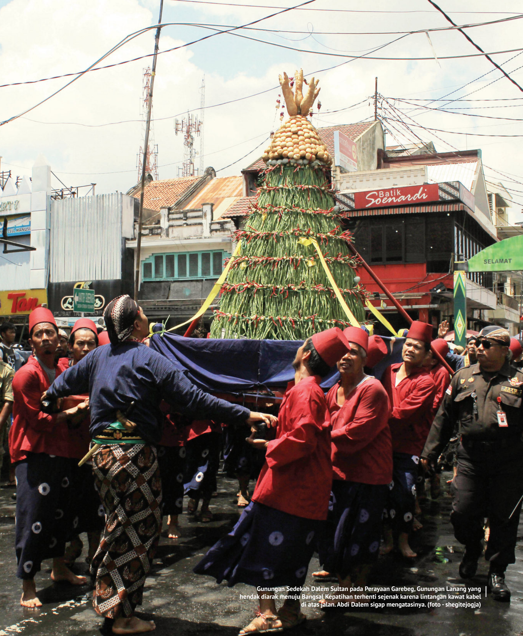
Gunungan Sedekah Dalem Sultan pada Perayaan Garebeg, Gunungan Lanang yang hendak diarak menuju Bangsal Kepatihan terhenti sejenak karena lintangan kawat kabel di atas jalan. Abdi Dalem sigap mengatasinya.