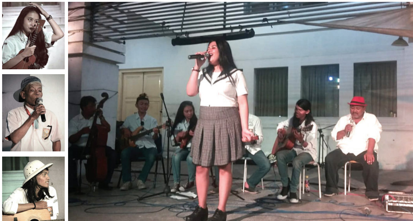
Tim Orkes Kroncong Sakpenake dan para artisnya, saat melakukan pertunjukan pemanasan pra FKY 2019 di lajur lambat Jalan Malioboro, mengisi peristiwa seni tengah malam.

F ESTIVAL Kesenian Yogyakarta 2018, FKY ke 30. Festival Kebudayaan Yogyakarta 2019 bukan FKY 31. Tapi Festival Kebudayaan Yogyakarta, FKY 1 untuk dan atas nama kebudayaan . Sebagai festival yang sinambung, bolehkah FKY 2019 disebut FKY 30.1?