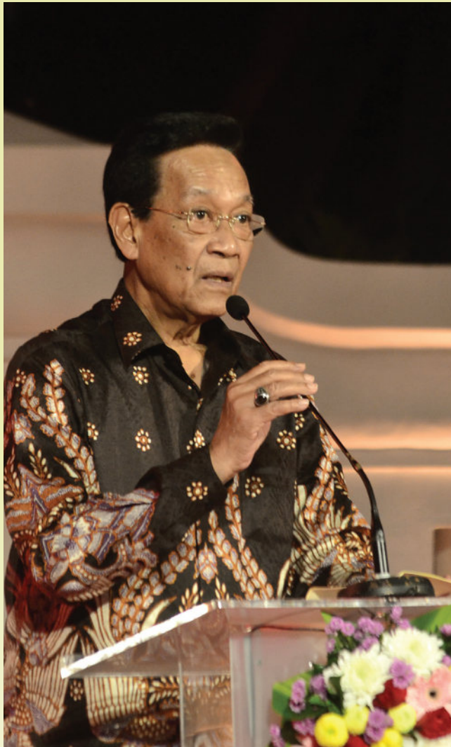
Sri Sultan Hamengku Buwono X saat menyampaikan pidato peringatan 30 tahun Jumenengan di Pagelaran Kraton Yogyakarta bersamaan dengan Pameran Naskah Kuno Kraton Yogyakarta, Maret 2019.

A PAKAH makna dan amanat seorang Sultan dan Gubernur DIY sekarang ini? Menjawab pertanyaan yang diajukannya itu, Sri Sultan Hamengku Buwono X dalam “Peneguhan Tekad Kembali Peringatan 30 Tahun Jumenengan” yang disampaikannya pada tanggal 7 Maret 2019 lalu, mengatakan pada intinya adalah membangkitkan Gerakan Kebudayaan, Babak Baru Renaisans Yogyakarta. “Kini renaissance telah menemukan padanan kata lokal ‘gumregah’ atau ‘bangkit kembali’. Bagaikan orang tidur ketika akan bangkit tergugah lebih dulu, terjaga atau ‘gumregah’. Untuk kemudian ‘gumrigit’, gumrigut-sengkud, golong gilik nyawiji, bangkit bersama-sama rakyat dalam sebuah Gerakan Kebudayaan menuju keistimewaan sejati, wahana akselerasi tercapainya kesejahteraan rakyat Yogyakarta,” katanya.