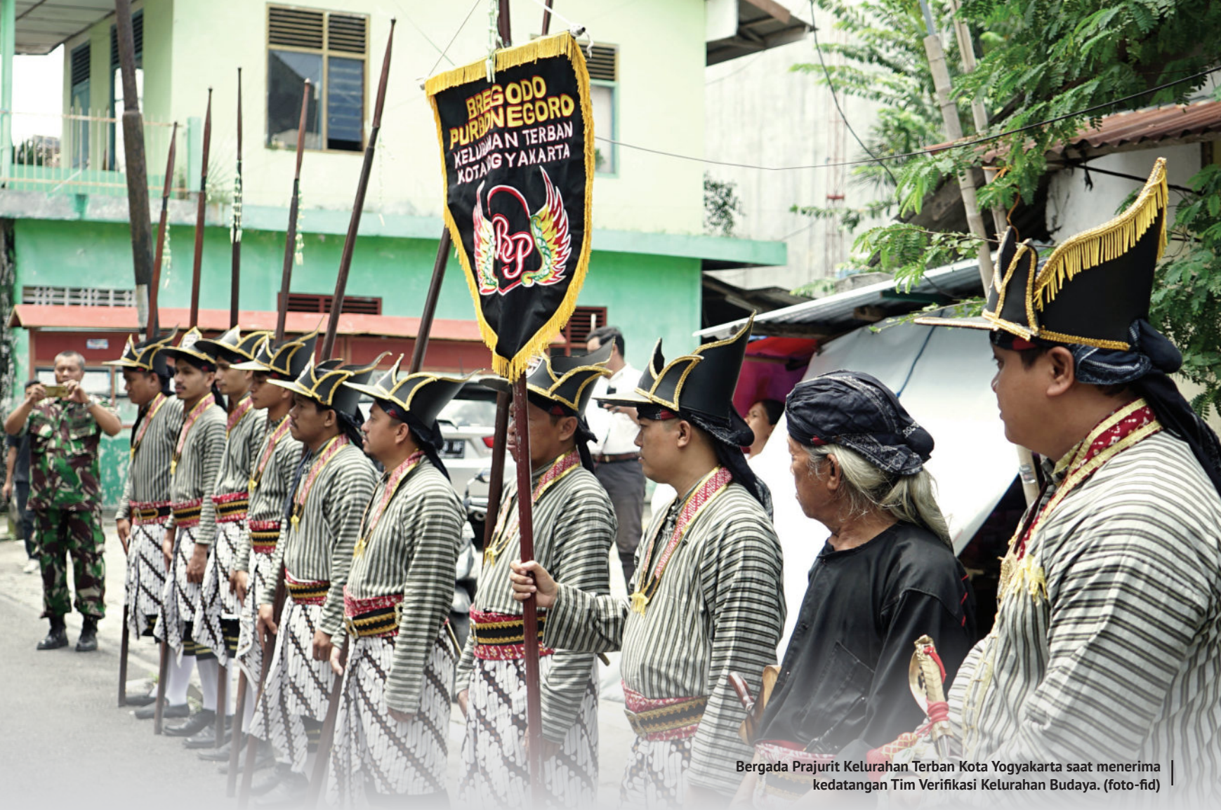
Bergada Prajurit Kelurahan Terban Kota Yogyakarta saat menerima kedatangan Tim Verifikasi Kelurahan Budaya.