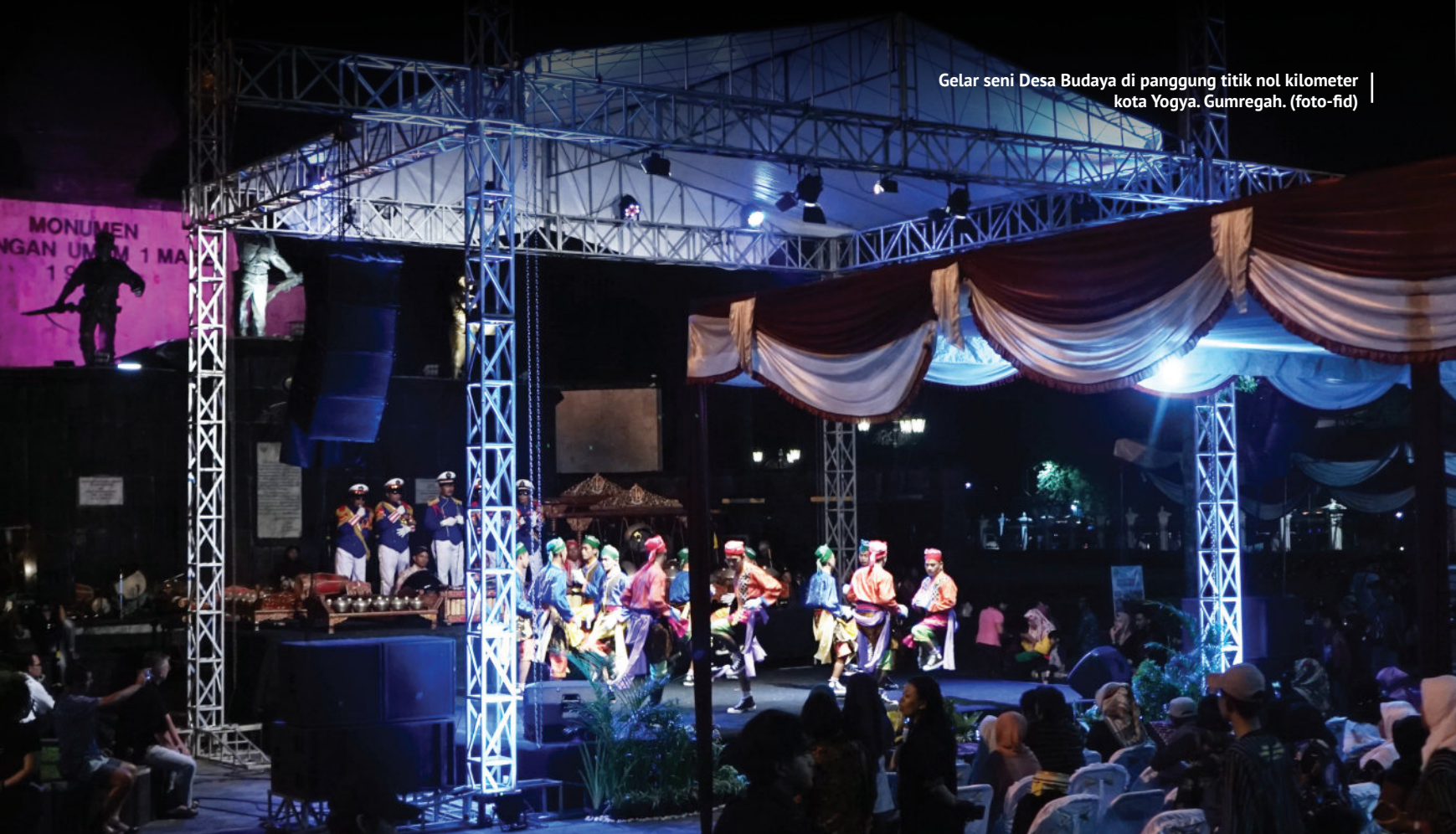
Gelar seni Desa Budaya di panggung titik nol kilometer kota Yogya. Gumregah.

Menurut rencana Dinas Kebudayaan DIY akan menggelar rutin sepanjang tahun sehingga 56 desa budaya berkesempatan tampil di pusat keramaian. Selain itu, karya budaya masyarakat desa budaya juga dirancang bisa mengisi seni pertunjukan di ruang keberangkatan bandara Yogyakarta Internasional Airport. Pada tampilan perdana, baik pertunjukan maupun anjungan penjualan produk mendapat respon antusias dari pesinggah kota Yogya. Tak sedikit wisatawan asing yang terkagum-kagum menyaksikan sampai akhir acara. (pdm)