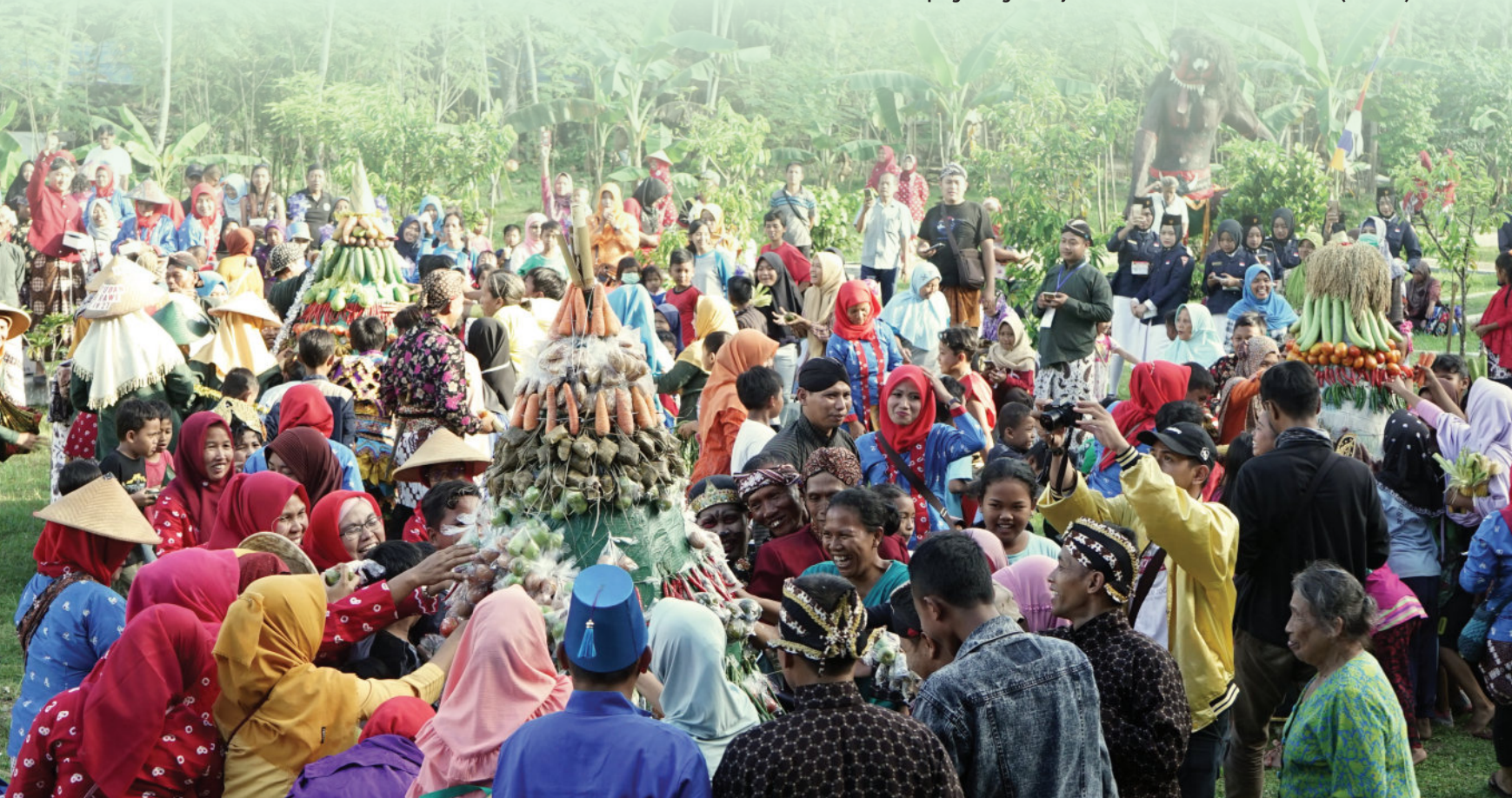
Perayaan merti desa, warga Rajeg, Tirtoadi, Mlati, Sleman, warga kumpul dan menikmati karya budaya mereka berupa gunung rakyat aneka hasil bumi dan masakan.

Lain waktu, Ifid menemukan kejutan, bentuk gunung yang di luar dugaanya. “Sebagai pemotret saya sudah tidak kaget dengan ragam bentuk gunung. Yang menarik justru arakan gunung sebagai peristiwa sosial. Yang mengusung lebih ekspresif,” katanya. (pdm)