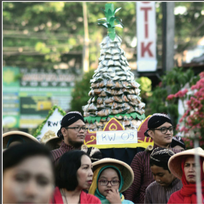
Kirab budaya pisungsun ruwahan kadipaten Yogyakarta