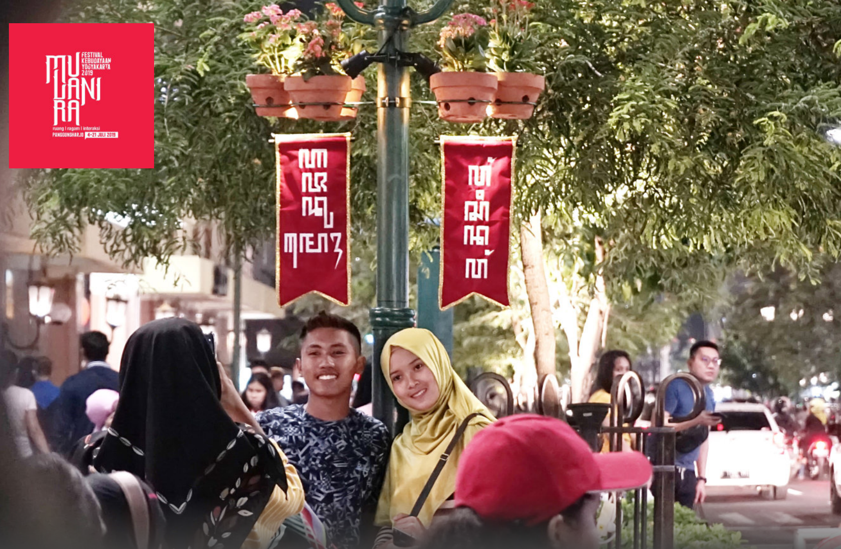
Pemanasan untuk penghangatan helat festival kebudayaan, FKY 30.1 digelar promo luar ruang dengan pemasangan sejumlah atribut informatif di Jalan Malioboro, termasuk unggahan aksara Jawa. Berikut pula sajian pawai Festival Kesenian Yogyakarta tahun-tahun sebelumnya.