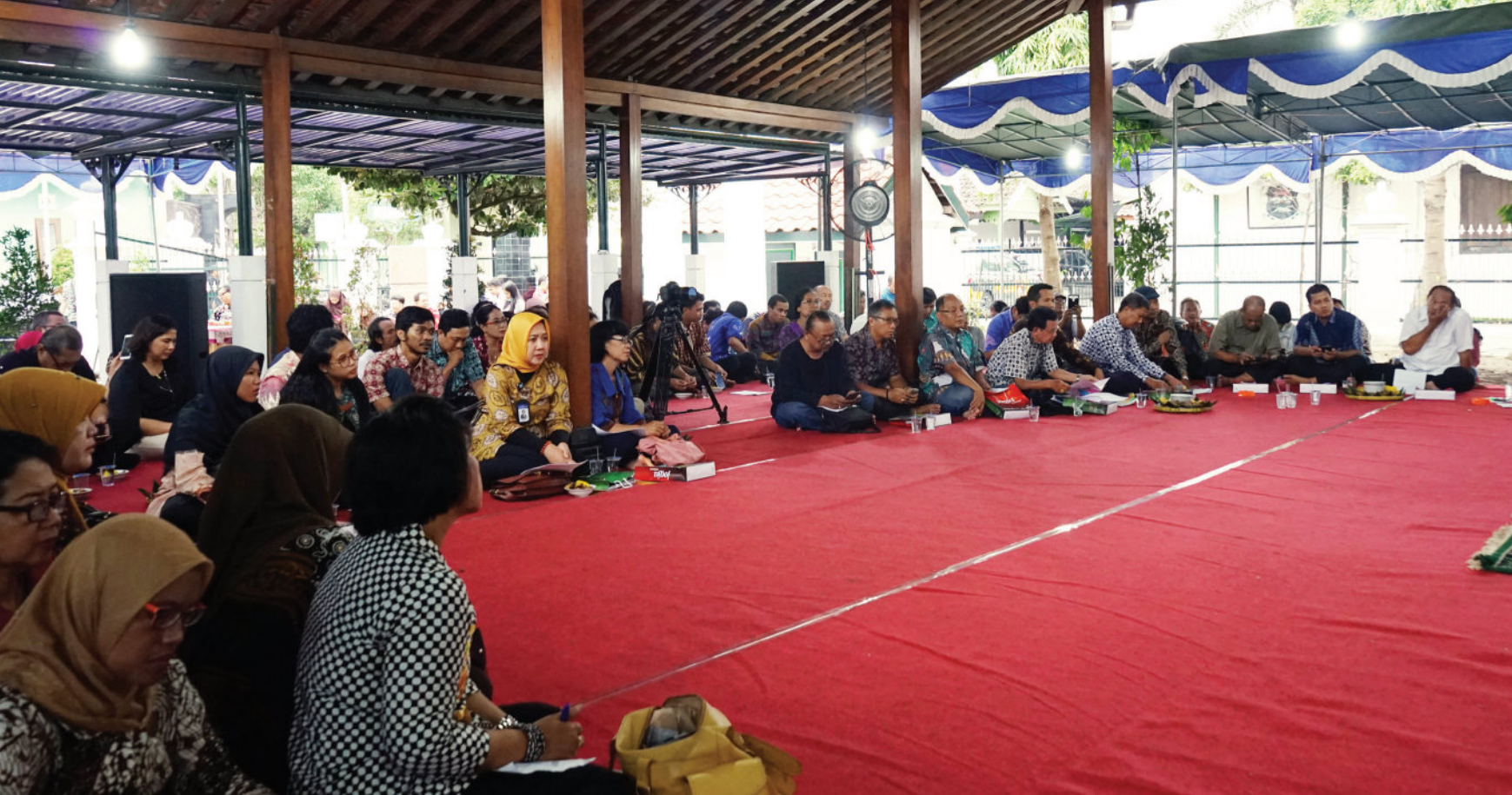
Peserta sarasehan dan dialog kethoprak dan sandiwara Jawa di Rumah Gamelan.

ekonomi masyarakat DIY. (4) Menggerakkan potensi kekayaan nilai-nilai tradisi kerakyatan dalam berseni kethoprak menjadi kekuatan yang mampu menjawab tuntutan kebutuhan masyarakat dalam seni pertunjukan saat ini dan mendatang. (5) Menyediakan sajian komodifikasi kethoprak berkualitas berwatak Yogyakarta, yang menjadi tolehan utama masyarakat dunia.